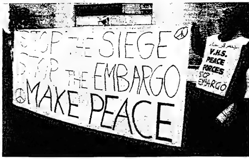
يقاد - جانب من المظاهرة التي قام بها أعضاء من المنظمة الفلسطينية، جسر الى بغداد، هذا أمس للمطالبة برفع الحظر الدولي المفروض على العراق.

لاهاي - اذهب - من المتوقع ان تبت محكمة العدل الدولية اليوم في مسألة اختصاصها بالنظر في قضية لوكربي التي تهم ليبيا على ارتكابها لاعتداءات جوية على طائرة الخطوط الجوية الماليزية رقم 103 في 23 ايلول 1988. وانظر هذا التحقيق مؤرخة في 11 كانون الثاني 1998. وقد اقرت المحكمة في 19 كانون الثاني 1998 اختصاصها بالنظر في القضية. وقد اقرت المحكمة في 19 كانون الثاني 1998 اختصاصها بالنظر في القضية. وقد اقرت المحكمة في 19 كانون الثاني 1998 اختصاصها بالنظر في القضية.